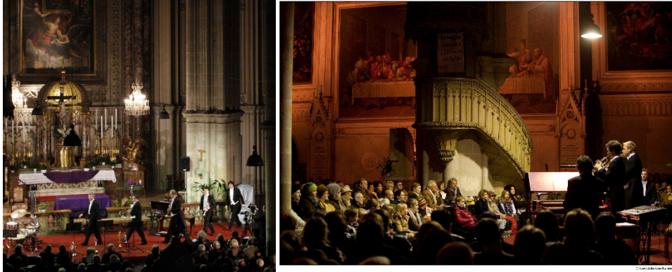
WEIHNACHTSKONZERTE IN DER MINORITENKIRCHE

Ihrem Konzertbesuch soll nichts im Wege stehen – Ihre Gesundheit hat für uns oberste Priorität. Wir haben die notwendigen Maßnahmen getroffen, um Ihren Besuch in der Minoritenkirche so sicher und gleichzeitig komfortabel wie möglich zu gestalten und freuen uns, Sie wieder bei uns begrüßen zu dürfen!