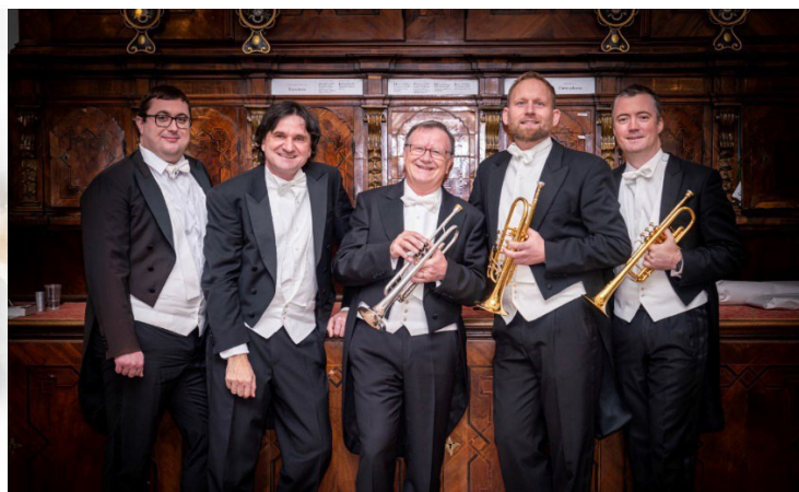
Trumpets in Concert

Trumpets in Concert (kurz TIC ) hat seine eigene Magie. Jeder wird sie auf seine Weise beschreiben. Wir fanden sie im geglückten Einklang zwischen Vergangenheit und Gegenwart. Sie haben den Charme und die Schönheit vergangener Jahrhunderte aufgefangen und neu zum Blühen gebracht, in einer Klanglandschaft, die edelsten zeitgenössischen Stil zeigt.