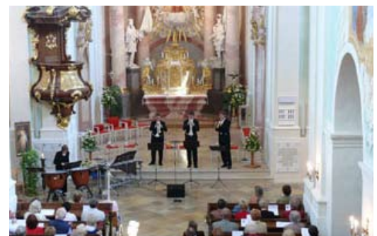
Basilika Klein Mariazell

Die Konzertprogramme im Detail und weitere Konzertbilder sehen Sie auf der Homepage www.leebmusic.com