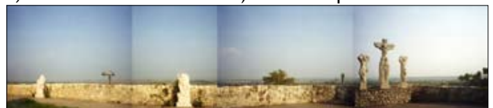
Blick von der Terrasse der Bergkirche Donnerskirchen auf den Neusiedlersee.