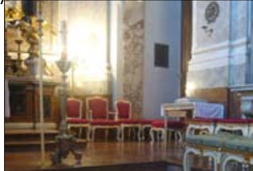
Schlosskapelle Schönbrunn

Konzerttermine Di. 16. Juni 2009, 14:00 Uhr (Nachmittagskonzert) Sa. 27. Juni 2009, 20:30 Uhr (Abendkonzert) Ausführende Leonhard Leeb, Trompete & Anton Holzpafel, Orgel Eintritt 23.- / 9.- € (bis 18 Jahre; Kinder bis 12 Jahre frei) freie Sitzplatzwahl