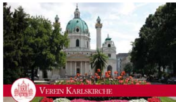
Karlskirche - eine der schönsten Barockkirchen Europas