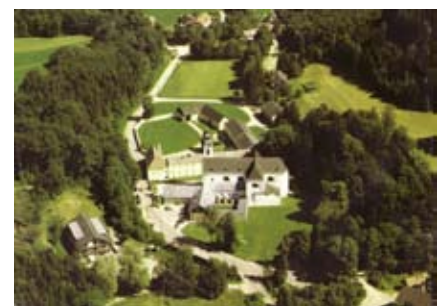
Basilika Klein Mariazell und Umgebung