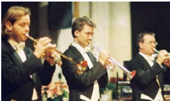
Trumpets in Concert